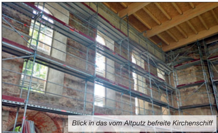
Blick in das vom Altputz befreite Kirchenschiff