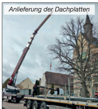
Anlieferung der Dachplatten

Kirchenvorstand der Kirchgemeinde Beicha-Mochau