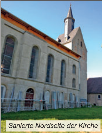
Sanierte Nordseite der Kirche

In Heft 1/2019 der Mochauer Rundschau haben wir über den damaligen Stand unseres Bauvorhabens berichtet. Die Zimmerleute hatten zu diesem Zeitpunkt die Verschalung des Kirchendachs bereits fertig gestellt. Noch im März wurde die Montage der Platten vorgenommen. Seitdem hat unsere Kirche endlich wieder ein Dach! Damit waren und sind aber die Arbeiten an unserer Kirche keineswegs abgeschlossen. Der alte Putz musste entfernt werden, um das Schiff neu putzen zu können. Im Projekt war das Putzabhacken als Eigenleistung der Gemeinde aus-