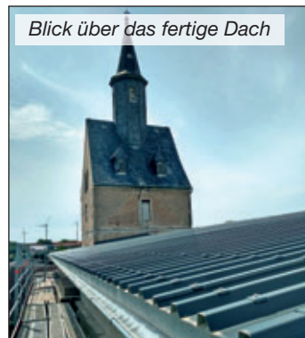
Blick über das fertige Dach