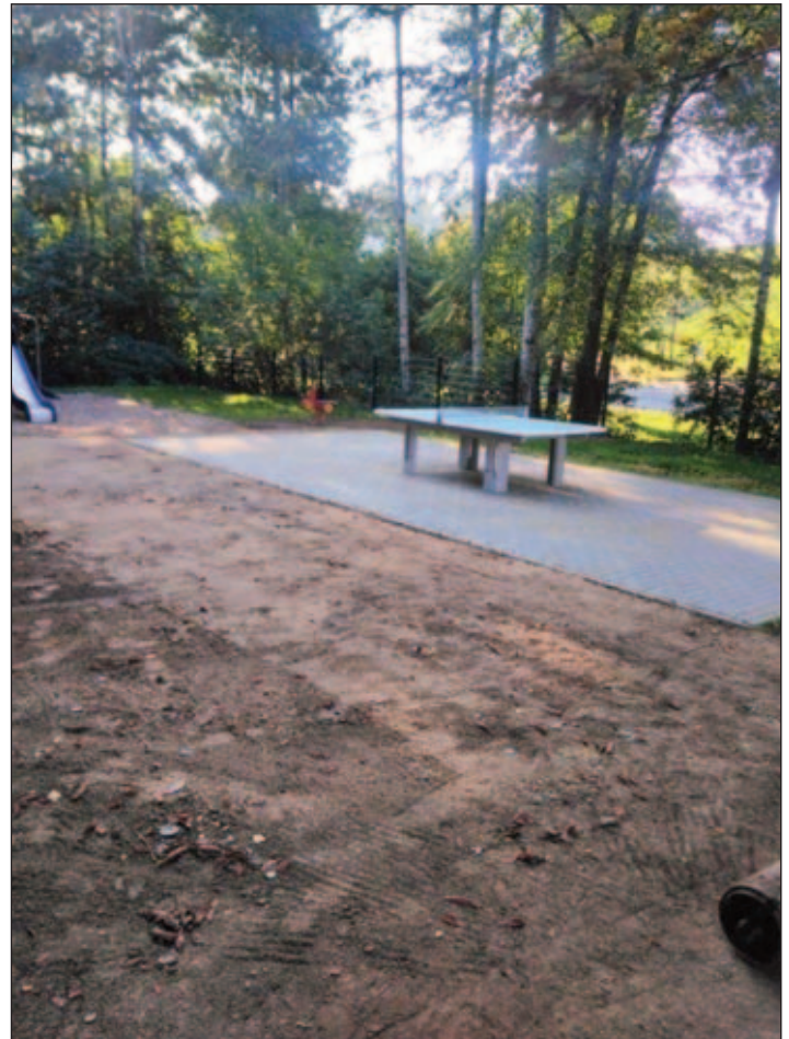
Neuer Spielplatz an der Turnhalle (Begrünung erfolgt noch vor der Eröffnung noch erfolgen)

Ihr Anzeigentelefon: 037208/876-100 – Riedel – Verlag & Druck KG