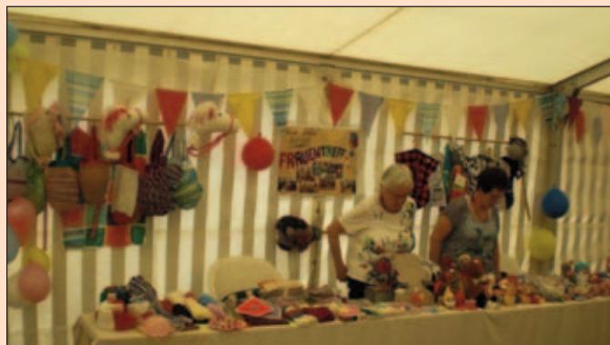
Verkaufsstand des Kreativ-Frauentreff

Die Frauen vom Kreativ-Treff boten wieder ein großes Angebot ihrer selbst gefertigten Exponate an.