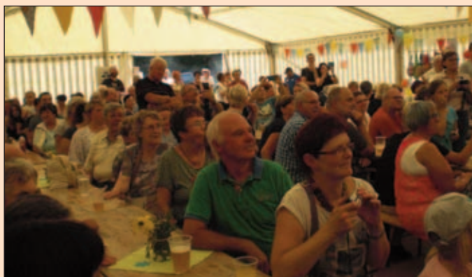
Ebersbach feiert das 7. Vereinsfest

Am 26.08.2017 feierten die Ebersbacher nun schon zum siebenten mal ihr Vereinsfest. Wie in den Vorjahren wurde der Platz an der Turnhalle Ebersbach zum Festplatz.